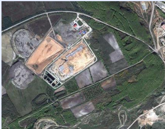
Αποτύπωση οικοπέδου κατασκευή ΜΕΑ και ΧΥΤΥ